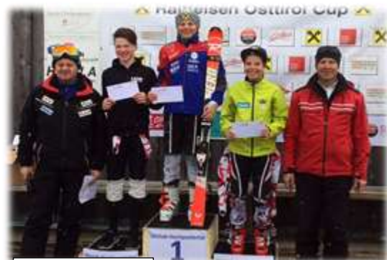
Schüler-SL – U14

Der Skiclub Hochpustertal bedankt sich bei den Sponsoren der Veranstaltung: