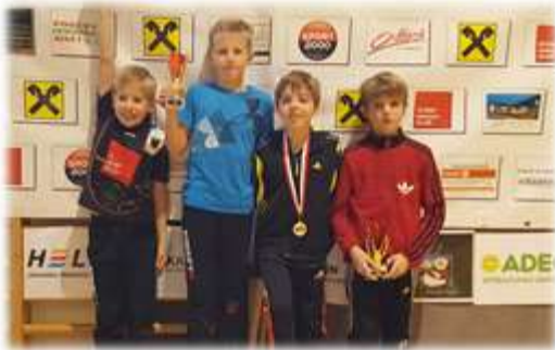
Kinderkader – Skiclub Hochpustertal