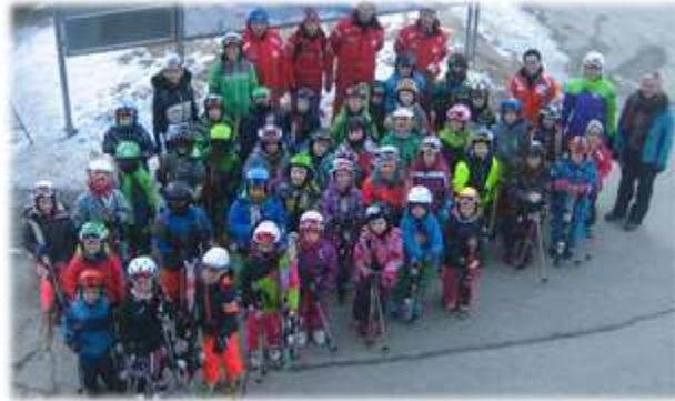
Volksschule Abfaltersbach am 24. Jänner 2017 42 Kinder

Zum vierten Mal haben wir gemeinsam mit den Volksschulen und Kindergärten unserer Partnergemeinden einen Skitag am Thurntaler angeboten. Für 200 Schul- und Kindergartenkinder ist dieser besondere Schultag völlig kostenfrei. Ermöglicht wird dies durch ein Förderprogramm von Seilbahnwirtschaft und Land Tirol (=Liftkarten), durch günstige Konditionen der Skischule (=Kostenübernahme durch Skiclub Hochpustertal), Bergrestaurant Gadein (=Jause) sowie Sponsoren und Subvention der Gemeinden.