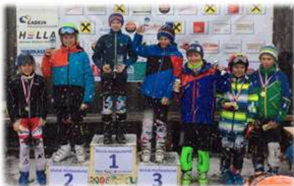
Kinder-SL – U11