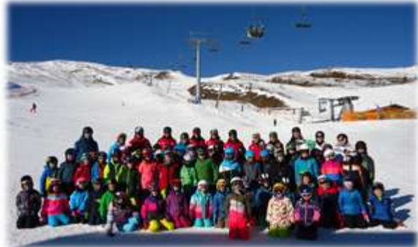
Volksschule Sillian am 25. Jänner 2017 64 Kinder