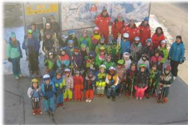
Volksschule und Kindergarten Strassen am 27. Jänner 2017 - 46 Kinder